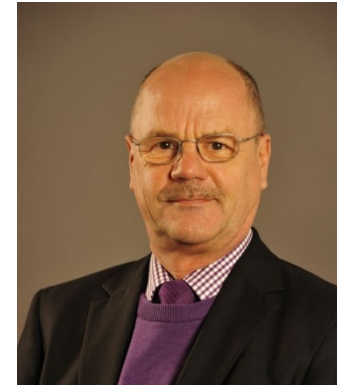
M. Wenk als direkter Ansprechpartner

Aktuelle Informationen unter: www.perspektive-kruemmel.de und Facebook